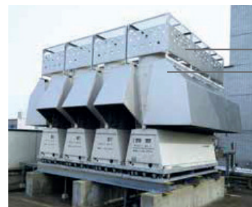
Universal Smart X EDGE

Mreža za zaštitu od snega Prekrivka za zaštitu od snega